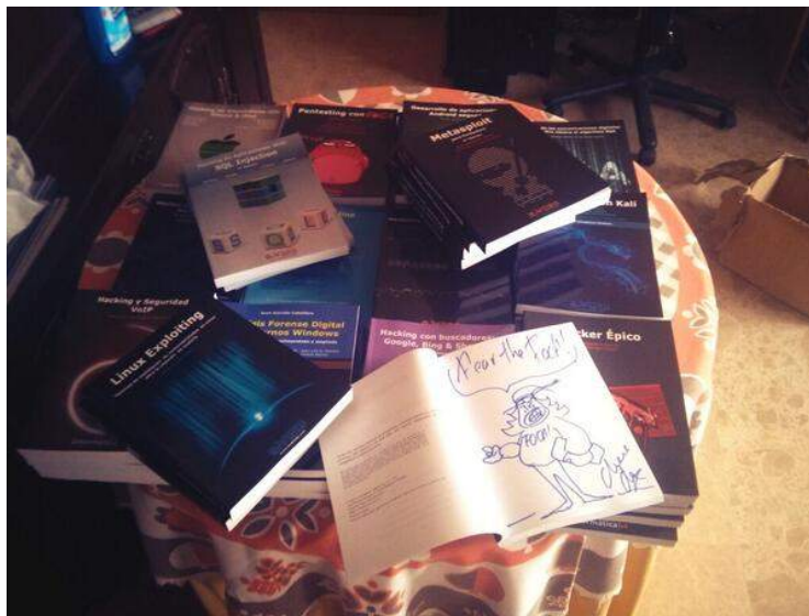
Materiales aportados por OXWord para MorterueloCon 2014

Apoyo con otro tipo de recursos, tanto personales como productos propios de la empresa u otros servicios que deseen aportar. En caso de que esta colaboración alcance el presupuesto mínimo referente a alguno de los anteriores patrocinadores, dicho colaborador podrá atenerse a las ventajas correspondientes.