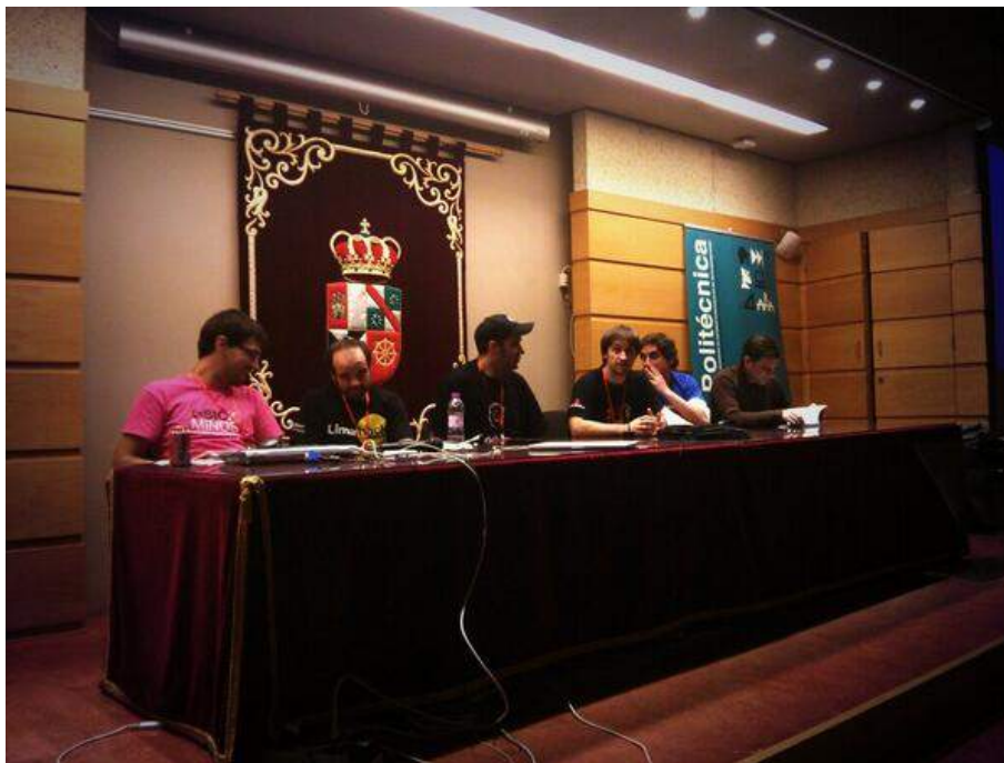
Ponentes de MorterueloCon 2014